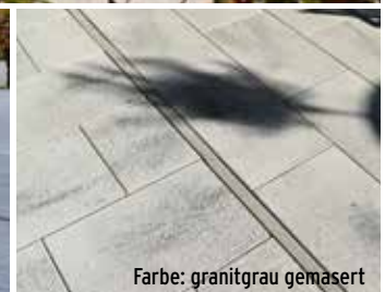
Farbe: granitgrau gemasert