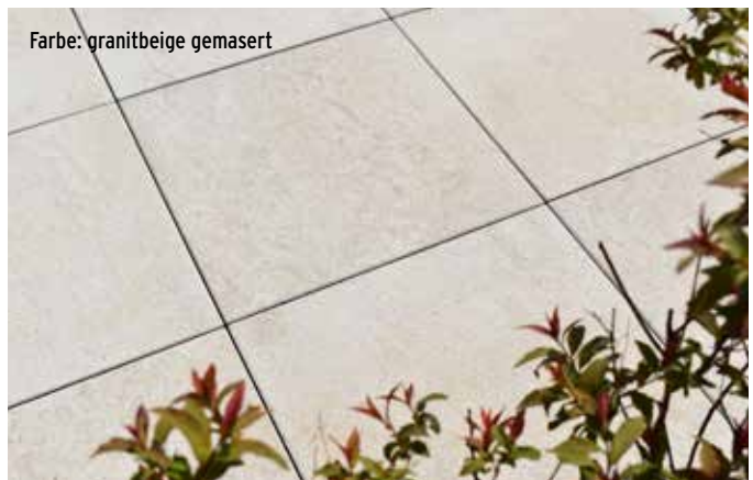
Farbe: granitbeige gemasert

Profitieren Sie von der umfassenden Auswahl, der kompetenten Beratung und dem Verlegeservice in Ihrem Salzburger Lagerhaus.