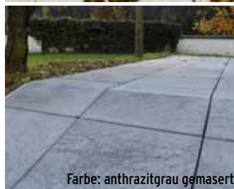
Farbe: anthrazitgrau gemasert